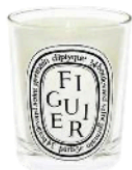
Seit 60 Jahren die Beste: Duftkerze „Figurier“ von DIPTYQUE, um 60 €