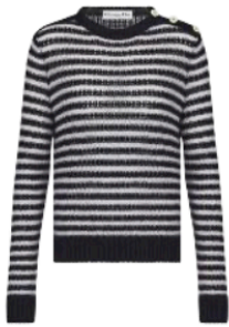
Maritimer Klassiker: Bretonpullover aus Alpakamix, von CHRISTIAN DIOR, um 1500 €