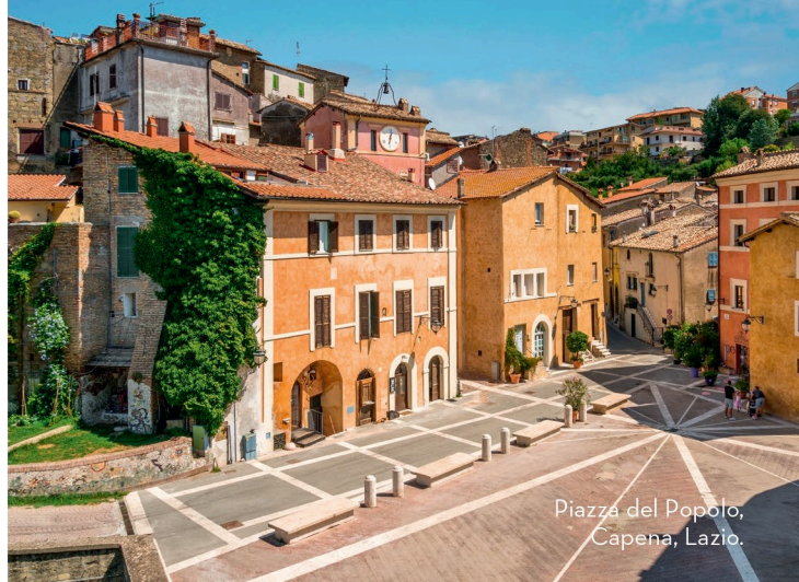
Piazza del Popolo, Capena, Lazio.