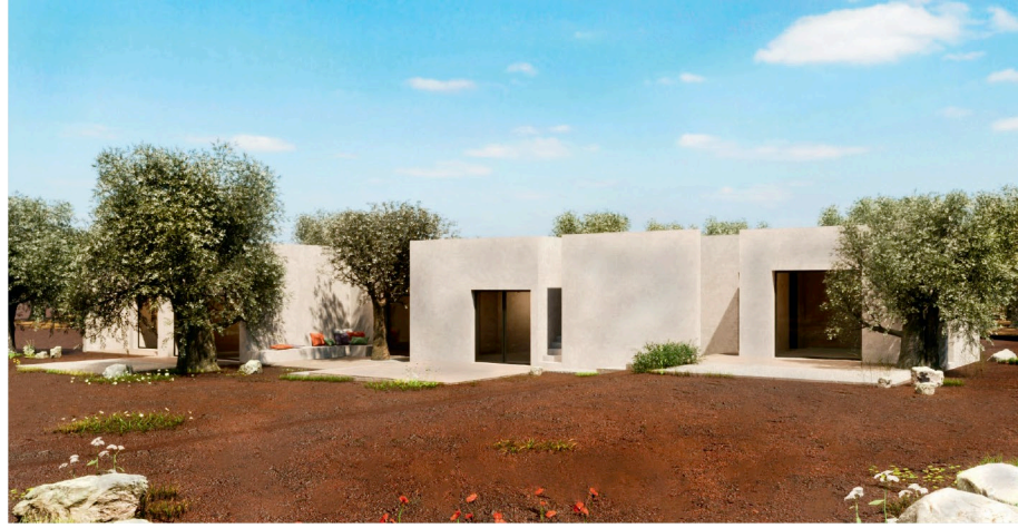
Lenny Valentino Schiaretti e due progetti del suo studio di architettura, Atelier LVS, in Puglia (sopra) e in Toscana (sotto).